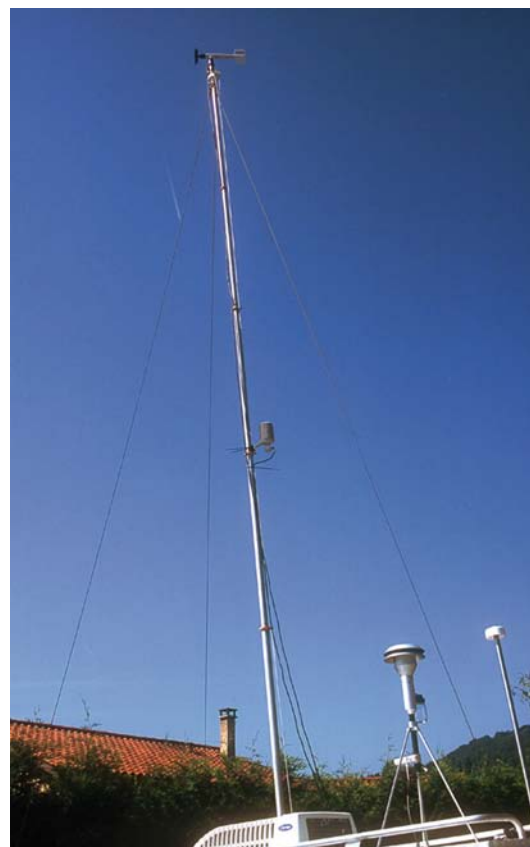
Station de mesure pour la qualité de l'air et les pollutions atmosphériques . COPARLY.